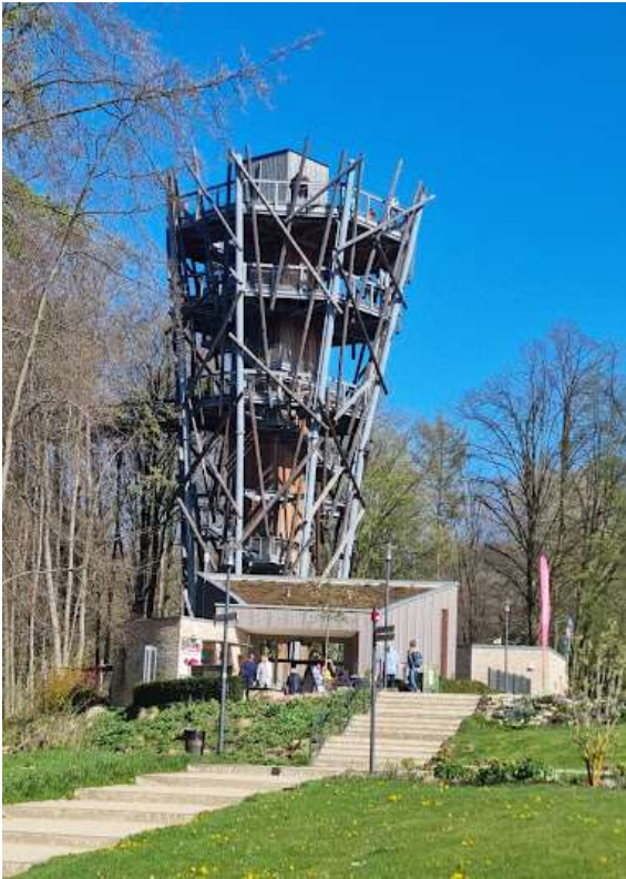
Baumwipfelpfad Bad Iburg - barrierefrei

Abfahrt 08.00 Uhr am WEZ Lahde, 08.15 Uhr ZOB Petershagen, Retour ca. 18.30 Uhr